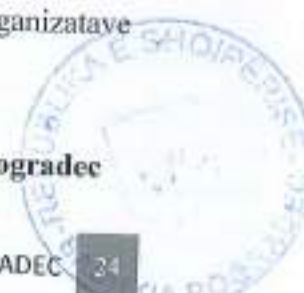
Tabela 18. Popullsia Rome dhe Egjiptiane në qytetin dhe fshatrat e Bashkisë Pogradec

Sipas tabelës më poshtë në Bashkinë Pogradec familjet R/E jetojnë kryesisht në qytetin e Pogradecit dhe në fshatrat Buçimas, Çerravë dhe Guras. Në dy zona periferike të qytetit Pogradec, në Guri i Kuq dhe Gurore banojnë disa familje R/E. Sipas studimit të CESS dhe UNICEF (2013) popullsia Rome në Bashkinë e Pogradecit është 566 familje. Ndërsa popullsia Egjiptiane, sipas intervistave të realizuara me përfaqësues të organizatave Egjiptiane, është rreth 600 familje.